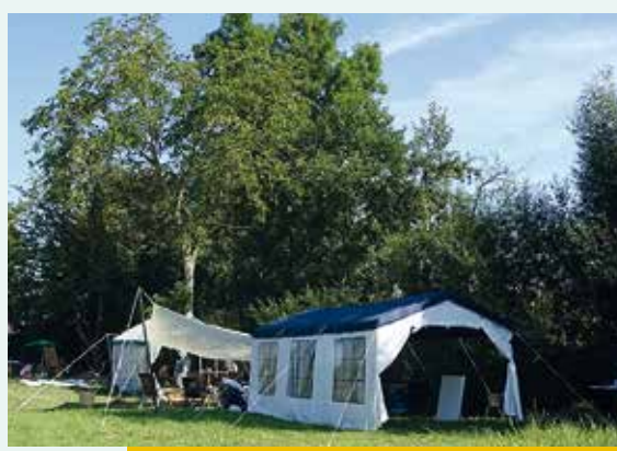
◀ Sommeratelier an der Modau

Kurszeiten: Freitag und Samstag 10:00 bis 18:30 Uhr, Sonntag 10:00 bis 13:00 Uhr Kosten: 210,- Euro Kurs + 25,- Euro Material