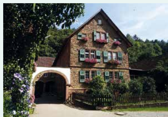
Mühlenatelier Nieder-Modau ▶